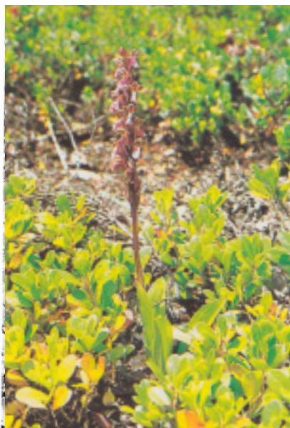
Orchis spitzelii Château-Queyras, Hte Alpes 12/06/82

Il ressort enfin de la nouvelle répartition que, parmi les orchidées protégées de France, O. spitzelii se détache nettement du groupe des reliques à la limite de la disparition. Mais cette relative prospérité est très précaire parce qu'elle repose en grande partie sur une demi-douzaine de localités très