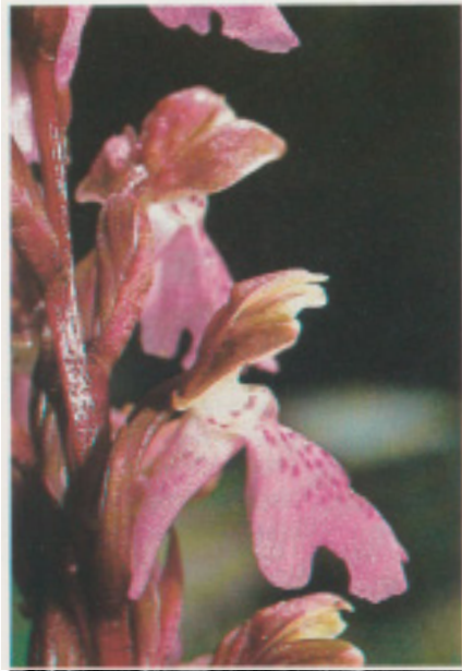
Orchis spitzelii Château-Queyras, Hte Alpes 12/06/82

Bien qu'elles soient de plus en plus visitées, les quelques stations que j'ai pu revoir le 20 mai 1982 entre Thorenc et le Logis du Pin m'ont semblé très stables. Leurs populations étaient identiques en nombre de pieds fleuris à celui des années précédentes (Delforge & Tyteca, 1982).