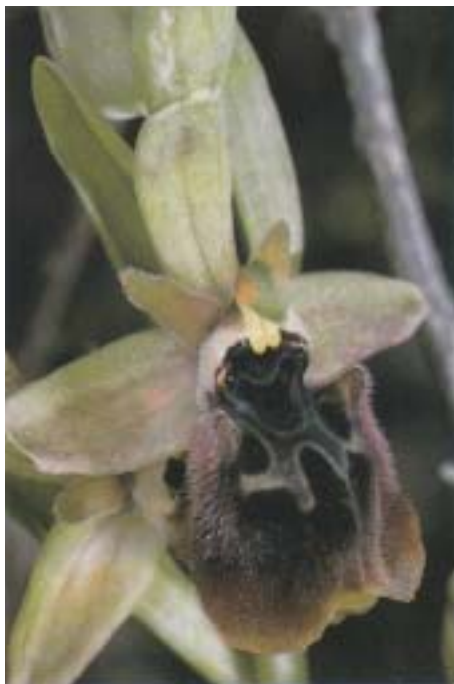
Fig. 6 Ophrys x cailliauana. Chypre, Akamas, 06.04.1989.