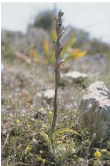
Fig. 2. Serapias aphroditae. Chypre, Akamas, 05.04.1989.