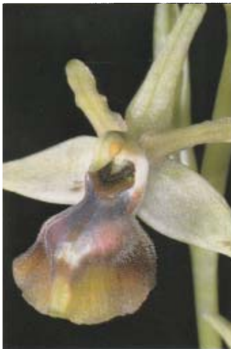
Fig. 8. Ophrys x demangeana. Chypre, Larnaca, 29.03.1989.