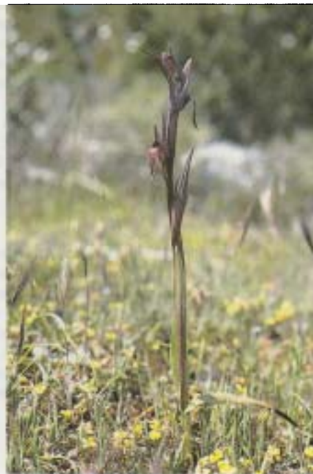
Fig. 9. Serapias x mastiana. Chypre, Akamas, 05.04.1989.