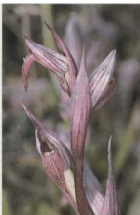
Fig. 3. Serapias aphroditae. Chypre, Akamas, 05.04.1989.