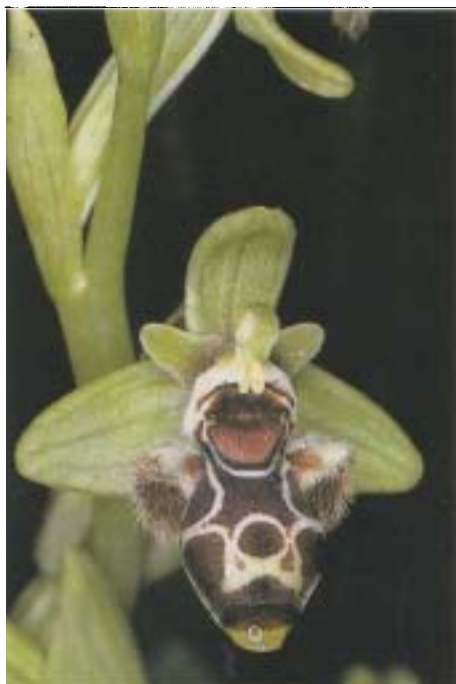
Fig. 5. Ophrys cf. aesculapii. Chypre, Larnaca, 29.03.1989.