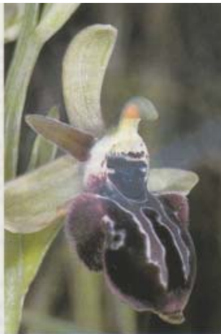
Fig. 7. Ophrys x kreutziana. Chypre, Larnaca, 29.03.1989.