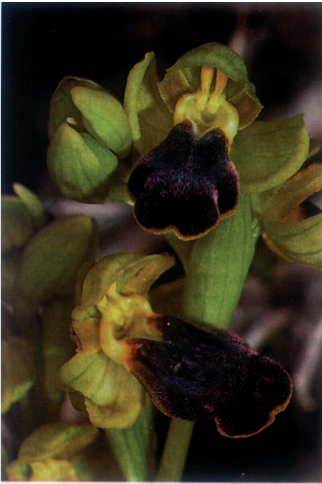
Fig. 3. Ophrys bilunulata . Malte, 26.II.1993.