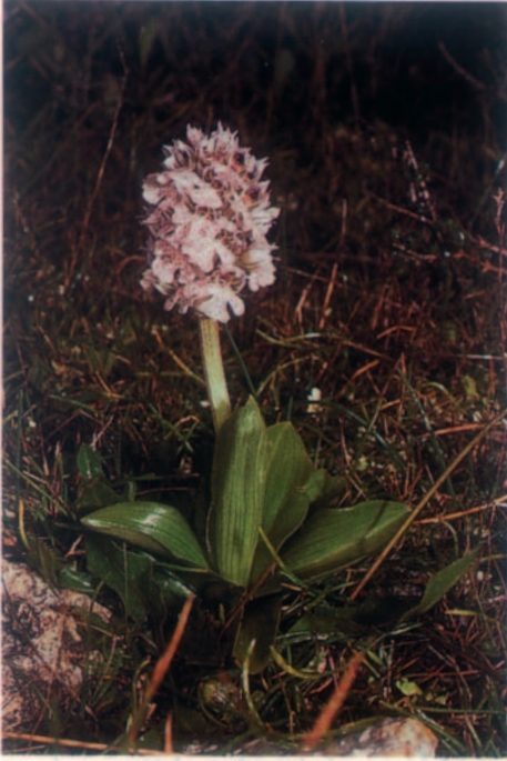
Fig. 1. Orchis conica . Malte, 22.II.1993.