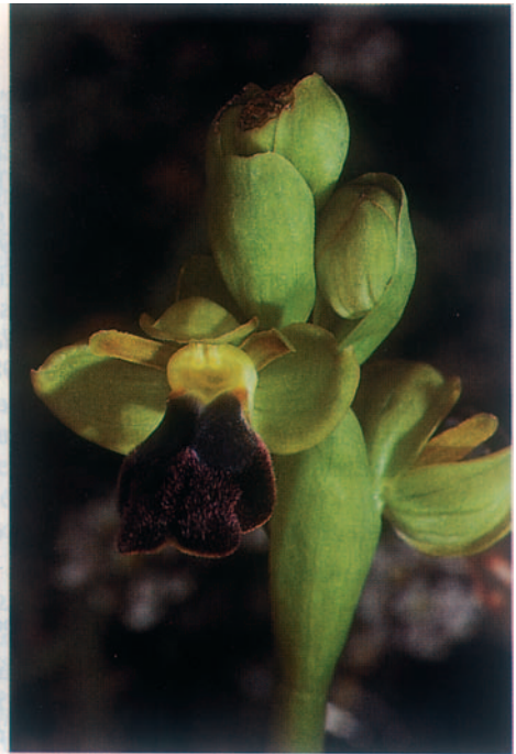
Fig. 4. Ophrys fusca . Malte, 27.II.1993.