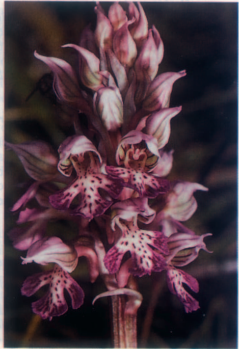
Fig. 2. Orchis conica . Malte, 23.II.1993 (dia P. DELFORGE).

Orchis conica , décrit du Portugal, n'a été formellement distingué que récemment (TYTECA 1984). Cette distinction, qui est justifiée par un ensemble de caractères morphologiques et phénologiques souvent tranchés (Tab. 1), commence à être admise aujourd'hui (par exemple BUTTLER 1986, BLAIS & GACHET 1993). Ce sont surtout les différences de structure des labelles qui permettent de séparer nettement O. conica d' O. lactea ; les dimensions sont, comme souvent, moins opérantes même si, en moyenne, O. lactea a des fleurs plus grandes et des inflorescences moins denses (BUTTLER 1990).