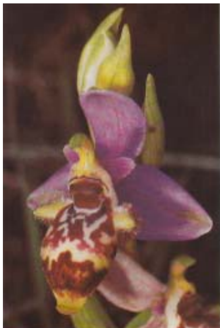
Fig. 5. Ophrys cf. breimifera . Grèce, Ithaque, 22.IV.1993.