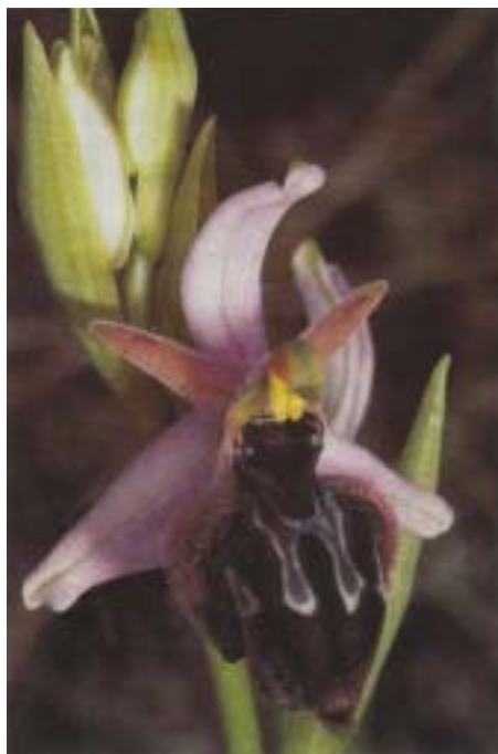
Fig. 16. Ophrys x walravensiorum ( O. tenthredinifera x O. gottfriediana ). Grèce, Céphalonie, 5.IV.1991.