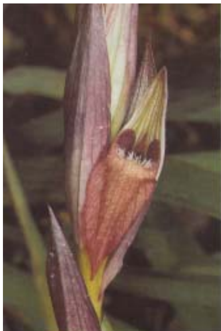
Fig. 13. Serapias bergonii . Grèce, Ithaque, 21.IV.1993.