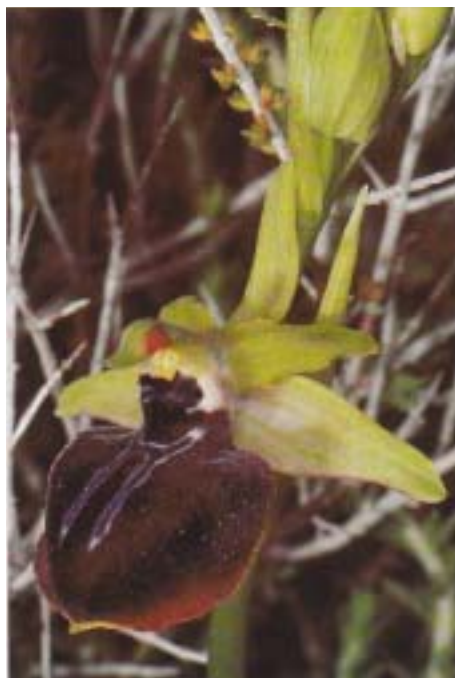
Fig. 8. Ophrys ferrum-equinum . Grèce, Ithaque, 21.IV.1993.