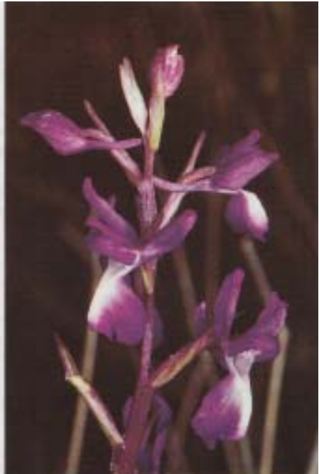
Fig. 10. Orchis laxiflora . Grèce, Ithaque, 22.IV.1993.