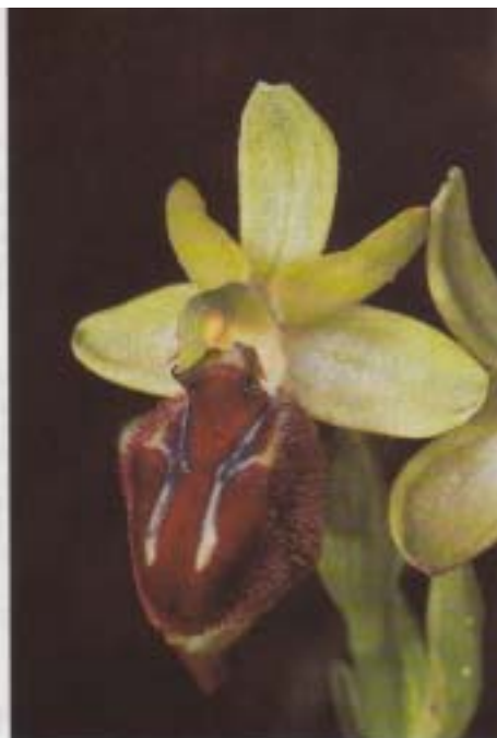
Fig. 6. Ophrys cephalonica . Grèce, Ithaque, 20.IV.1993.