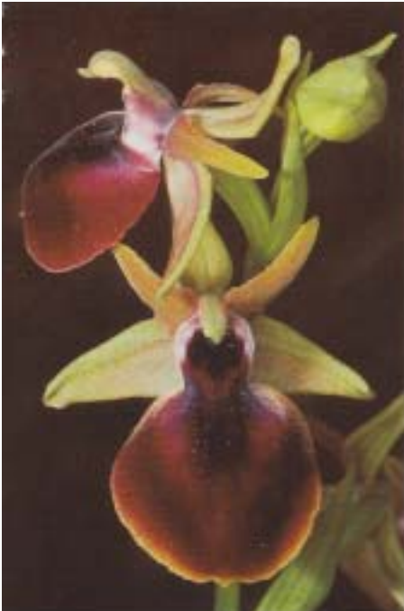
Fig. 9. Ophrys helenae . Grèce, Céphalonie, 28.IV.1993. (dia P. DELFORGE)