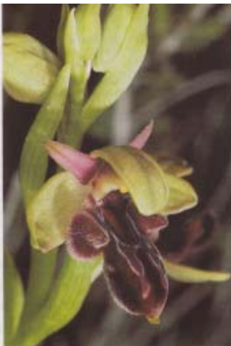
Fig. 14. Ophrys x painiana ( O. attica x O. gottfriediana ). Grèce, Céphalonie, 10.IV.1992.