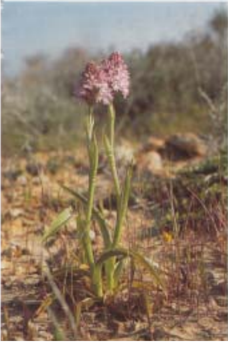
Fig. 1. Anacamptis pyramidalis . Grèce, Ithaque, 21.IV.1993.