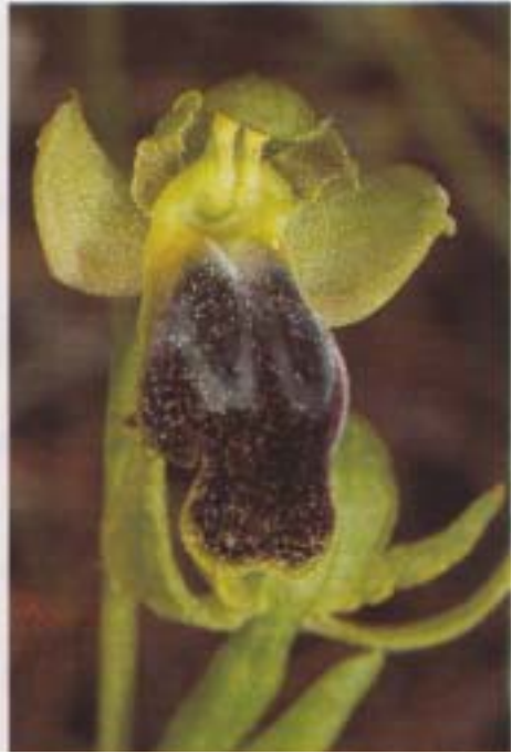
Fig. 2. Ophrys funerea . Grèce, Céphalonie, 27.IV.1993.