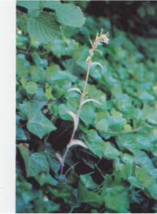
Fig. 2. Epipactis helleborine dépourvu totalement de chlorophylle. Belgique, Rhode-Saint-Genèse, 11.VII.1997.