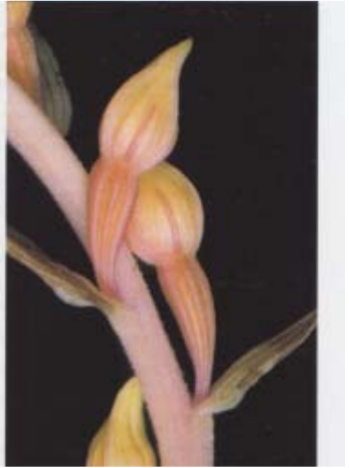
Fig. 3. Epipactis helleborine dépourvu de chlorophylle: les boutons floraux ont déjà pris une teinte dorée qui annonce la rapide nécrose complète de la hampe. Belgique, Rhode-Saint-Genèse, 15.VII.1997.