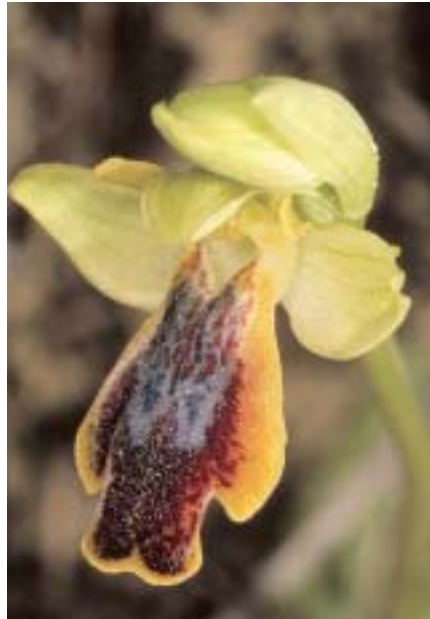
Planche 7. L'Ophrys d'Alicante.

En haut , à gauche: Ophrys lucentina , Alicante. 27.III.1999 (dia P. DELFORGE); à droite: fleur de la population-type d' O. dianica . Lliber. 26.II.2000 (photo de J. PIERA in LOWE et al. 2001: 635). Au-delà des différences de teintes, liées à la scannérisation des illustrations, les similitudes entre ces deux fleurs sont frappantes. En bas : Ophrys lucentina Alicante, à gauche, holotype, Sierra del Fraile 27.III. 1999 (dias P. DELFORGE).