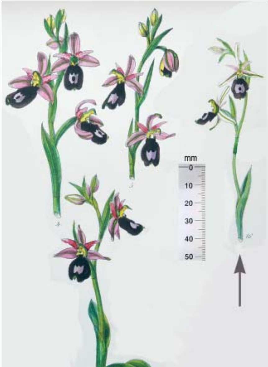
Fig. 1. Reproduction d'une partie de la planche 58 de BARLA (1868).

À gauche: trois inflorescences d' Ophrys aurelia , que BARLA appelle « Ophrys Bertoloni Morett.». À droite (flèche): inflorescence de l'holotype de « Ophrys Bertoloni Morett. var. aranifero-Bertoloni Barla et Sarato», taxon qui sera décrit plus tard, à partir de la même plante, sous le nom d' Ophrys saratoi par E.G. CAMUS (1893).