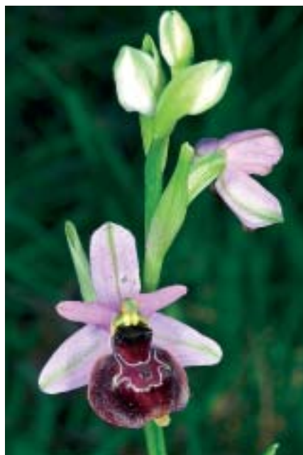
Planche 3. Orchidées hybrides du Vercors (France), 25-27.V. 2012.

En haut , à gauche: Dactylorhiza fuchsii × D. sambucina , Col des Limouches (site 3); à droite: Ophrys apifera × "Ophrys du Tricastin", Saint-Genis (site 2). En bas , à gauche: Ophrys drumana × O. insectifera , Les Vignes (site 11); à droite: Ophrys drumana × "Ophrys du Tricastin", Saint-Genis (site 2).