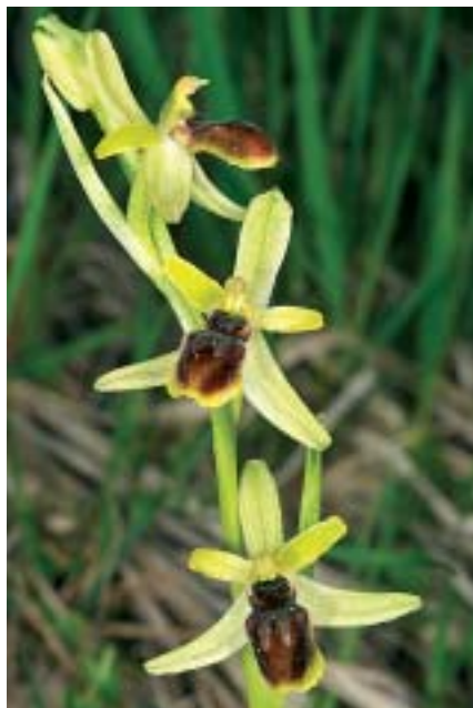
Planche 2. Orchidées du Vercors (France), Col du Prayet, 26.V. 2012.

En haut , à gauche: Cypripedium calceolus ; à droite: Corallorhiza trifida . En bas , à gauche: Orchis spitzelii ; à droite: Ophrys araneola .