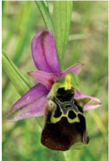
Planche 1. Ophrys du Vercors (France), 25-27.V. 2012.

En haut , à gauche: O. drumana , Les Vignes (site 11); à droite: O. saratoi . Saint-Genis (site 2). En bas , à gauche: "Ophrys du Tricastin", Beaufort-sur-Gervanne (site 8); à droite: O. druentica , Saint-Genis (site 2).