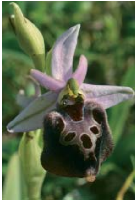
Planche 1. Orchidées de l'île de Cythère (Grèce).

En haut: Ophrys attica . Arei, 9 & 3 IV.2014. En bas à gauche: Paludorchis laxiflora . Geraki, 6.IV.2013; à droite: Ophrys calypsus var. pseudoapulica × O. ferrum-equinum . Arei, 1.IV.2014.