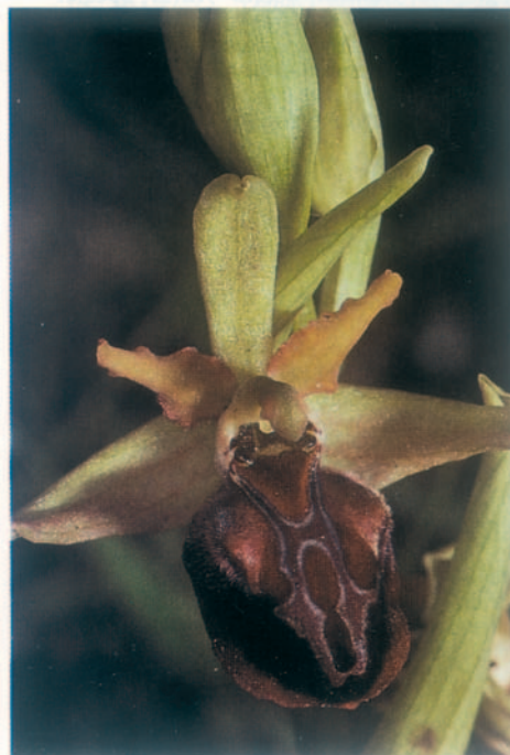
Fig. 6. Ophrys herae . Grèce, Zante, 6.IV.1993