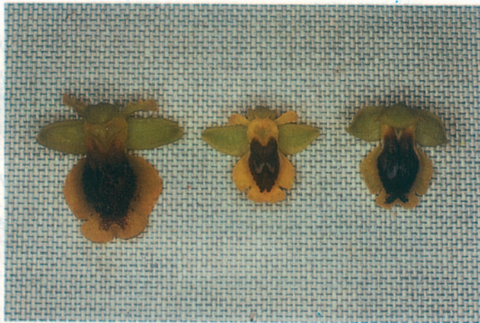
a b c Fig. 3. a: Ophrys lutea ; b: O. phryganae ; c: O. sicula . Grèce, Zante, 12.IV.1993.