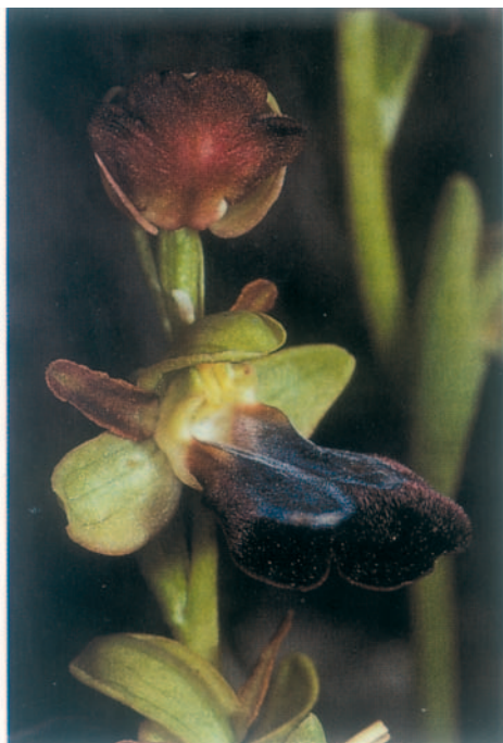
Fig. 4. Ophrys iricolor . Grèce, Zante, 8.IV.1993.