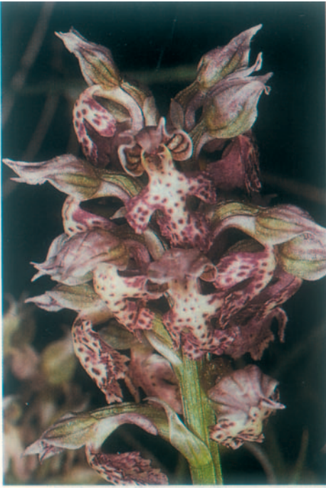
Fig. 8. Orchis lactea . Grèce, Zante, 8.IV.1993.