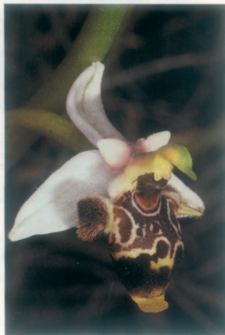
Fig. 7. Ophrys brevipifera . Grèce, Zante, 16.IV.1993.