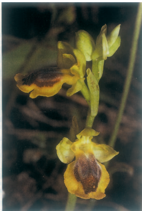
Fig. 5. Ophrys cf. melena . Grèce, Zante, 14.IV.1993.