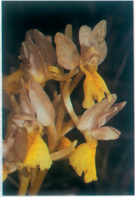
Fig. 9. Orchis pauciflora à casque blanc rosé. Grèce, Zante, 14.IV.1993.