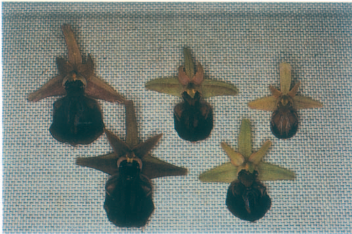
a b c d e Fig. 1. a,d: Ophrys mammosa ; c,e: O. herae ; b: O. herae x O. mammosa . Grèce, Zante, 6.IV.1993.