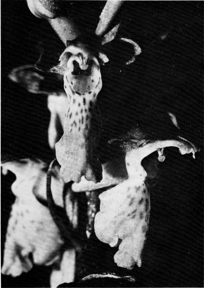
FIG. 8. - Orchis spitzelii , Montagne de Bleine, Préalpes de Grasse, 5 juin 1980.