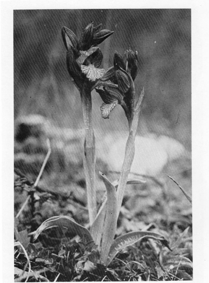
FIG. 7. — Orchis papilionacea subsp. grandiflora , Saint-Vallier, Préalpes de Grasse, 9 mai 1980.