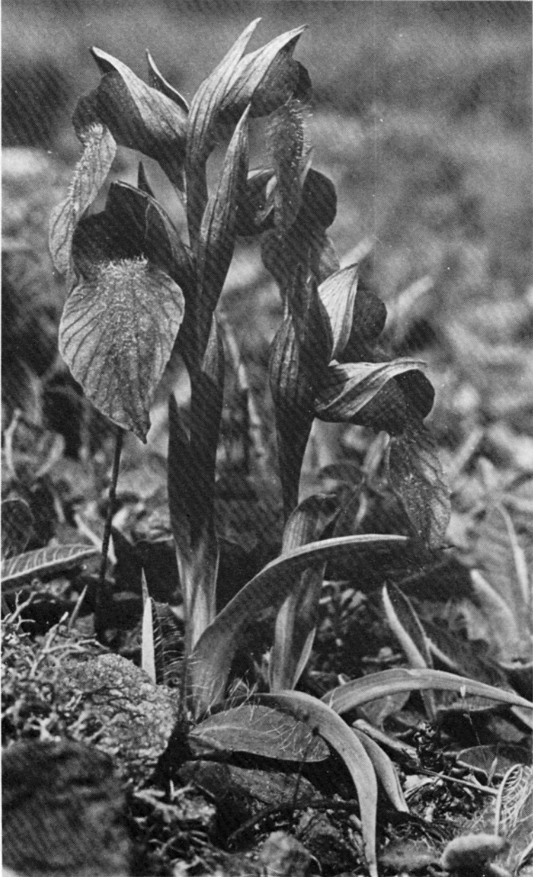
FIG. 5. - Serapias neglecta , Lac de Saint-Cassien, 29 avril 1980.