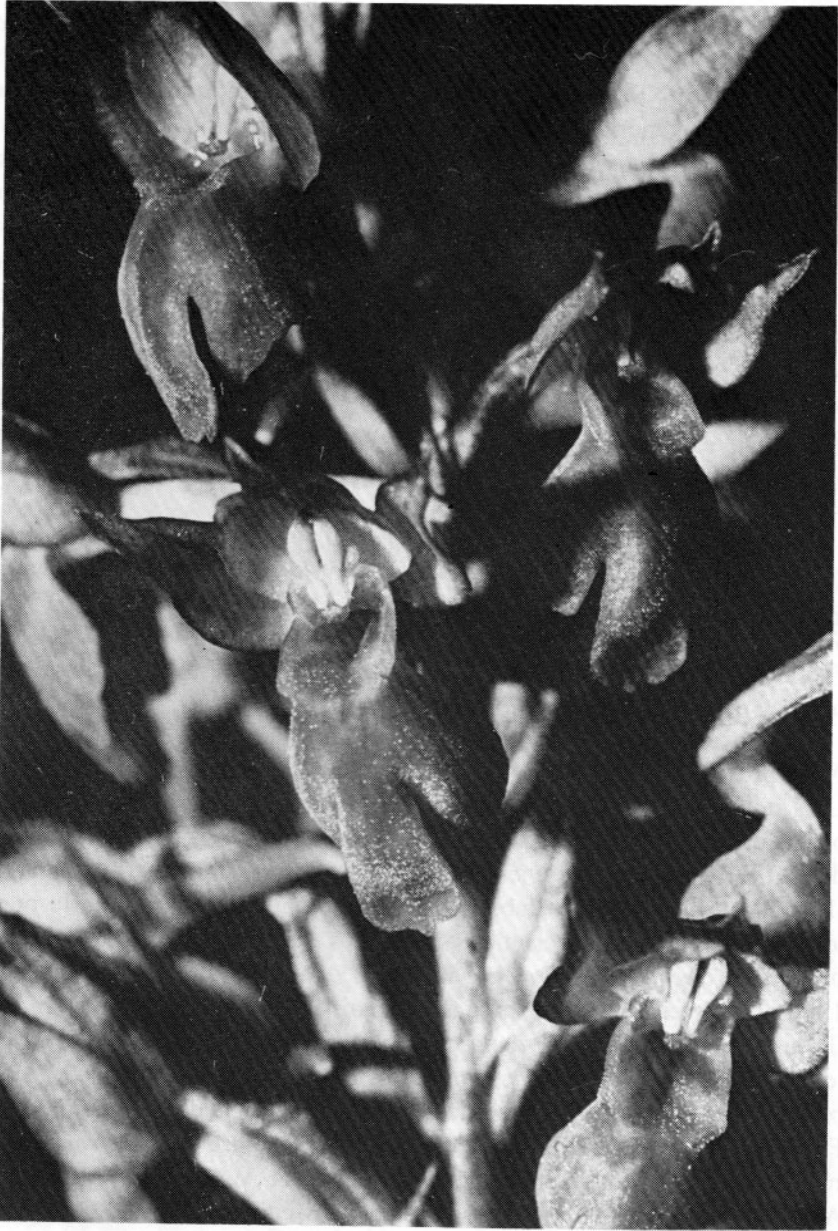
FIG. 2. - × Anacamptorchis simorrensis (= Anacamptis pyramidalis × Orchis coriophora subsp. fragrans ), Bois du Rouquan, Maures, 7 juin 1980.