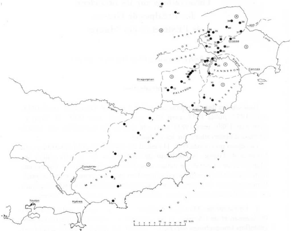
FIG. 1. - La région prospectée et les sites visités.

300 m, constitué de porphyres de même nature que ceux de l'Esterel. Nous incluons dans cette région les dépôts alluvionnaires de la basse vallée de l'Argens (environs de Fréjus).