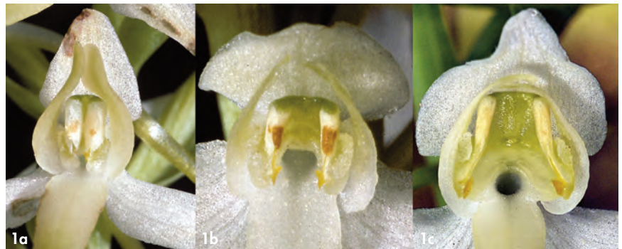
Fig. 1. – (a) Platanthera bifolia (s. str.): pollinies parallèles et rapprochées, caudicules courts; (b) P. ×hybrida : pollinies moins proches, un peu divergentes, caudicules de longueur intermédiaire; (c) P. chlorantha : pollinies écartées, divergentes à la base, caudicules allongés (Photos P. DELFORGE).

terrain, celles-ci se distinguent facilement au premier abord par la position de leurs pollinies, parallèles et rapprochées chez P. bifolia (Fig. 1a), écartées et largement divergentes à la base chez P. chlorantha (Fig. 1c). Des populations ou des individus intermédiaires entre les deux espèces ont généralement été considérés comme des hybrides et signalés sous le nom de P. ×hybrida Brügger. Ces hybrides semblaient facilement reconnaissables