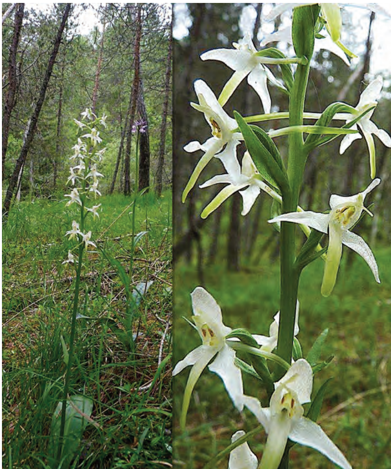
Fig. 7. – Platanthera cf. muelleri . France, Hautes-Alpes, Châteauroux-des-Alpes, Sainte-Croix, 2 juin 2012.

Deux autres sites, proches du premier, portant des populations similaires, ont été notés à Eternoz et à Vuillafans. Il s'agit chaque fois de pelouses calcicoles thermophiles sur des pentes marneuses, par places suintantes, où viennent également d'autres orchidées. À Eternoz et à Malans fleurissent une trentaine de platanthères, à