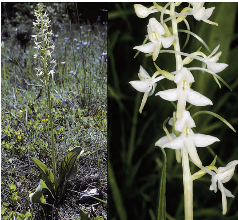
Fig. 3. – Platanthera fornicata . France, Bouches-du-Rhône, Jouques, 10 mai 2001.

BABINGTON (1836), le premier, distingua ces deux taxons et, après autopsie de l'holotype d' Orchis bifolia conservé dans l'Herbier LINNÉ [sub n°: LINN 1054.15], conclut que LINNÉ avait décrit le taxon de petite taille de milieux