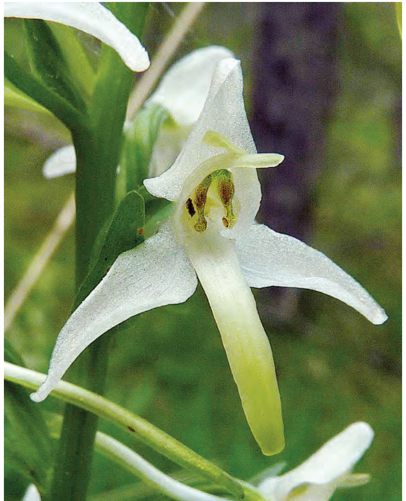
Fig. 8. – Platanthera cf. muelleri France, Hautes-Alpes, Châteauroux-des-Alpes, Sainte-Croix, 2 juin 2012 (Photo Ch. VERSTICHEL).