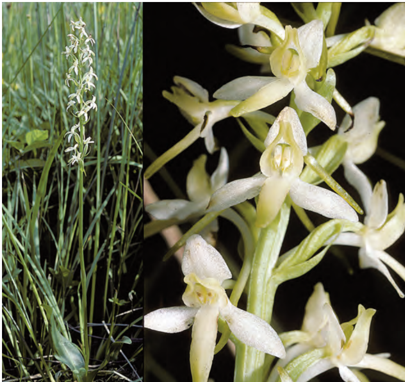
Fig. 4. – Platanthera bifolia . Belgique, province de Liège, Vielsalm, tourbière de La Grande Fange, 12 juillet 2006.