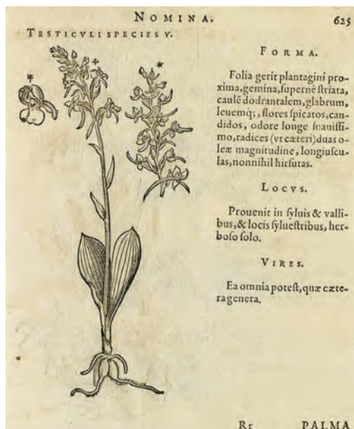
Fig. 5. – Testiculi species V. Lectotype de Platanthera bifolia choisi par BAUMANN et al. (1989), gravure de MATTHIOLI publiée par CAMERARIUS (1586: 625).

acides; en conséquence BABINGTON décrit le taxon calcicole de grande taille sous le nom d' Habenaria fornicata . Bien plus tard, BISSE (1963), apparemment sans connaître les travaux de BABINGTON, distingua à son tour les deux taxons mais considéra, quant à lui, que