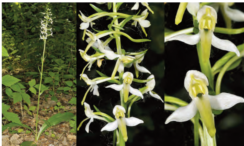
Fig. 6. – Platanthera muelleri . Belgique, province de Liège, Lanaye, Friche du Canal Albert, 28 mai 2011.

Alors que la prise en compte de Platanthera fornicata dans les Flores et les ouvrages spécialisés n'est pas encore effective, des recherches récentes ont remis en cause le statut de populations et d'individus habituellement considérés comme des hybrides entre P. chlorantha et P. « bifolia » .