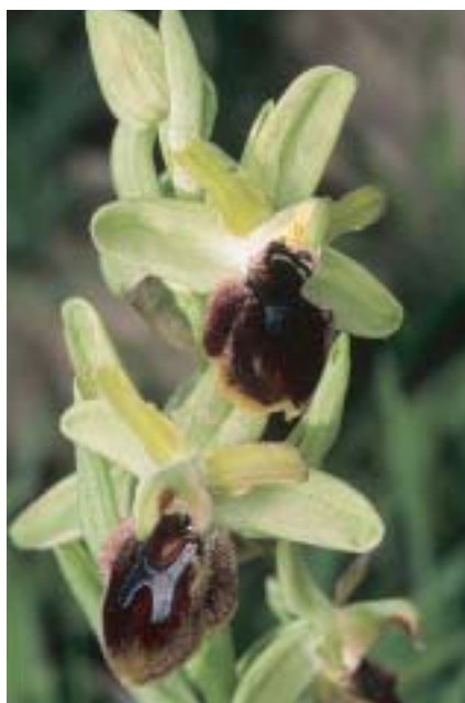
Planche 12. Ophrys cilentana .

En haut , à gauche: Campanie, Caserte, Pineta di Sessa. 28.III.2002; à droite: Calabre, Cosenza, mont Pollino. 8.IV.2002. En bas : Campanie, Salerne, Cilento, 5.IV.2001 et 1.IV.2002.