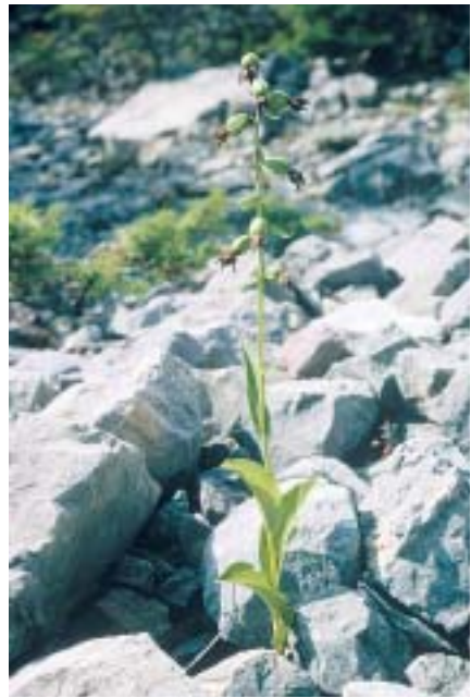
Planche 1. Epipactis heraclea . Grèce, Phthiotide, mont Ceta. 21.VII.2003.

En haut: plantes en pleine floraison; les feuilles sont réparties le long de la tige, l'inflorescence n'occupe pas plus du tiers de la hauteur de la tige. En bas, à gauche, groupe dense de 14 tiges, plantes tout en début de floraison; les feuilles ne sont pas tassées au bas de la tige ni teintées de violet; à droite: individu fructifiant en un milieu très xérique.