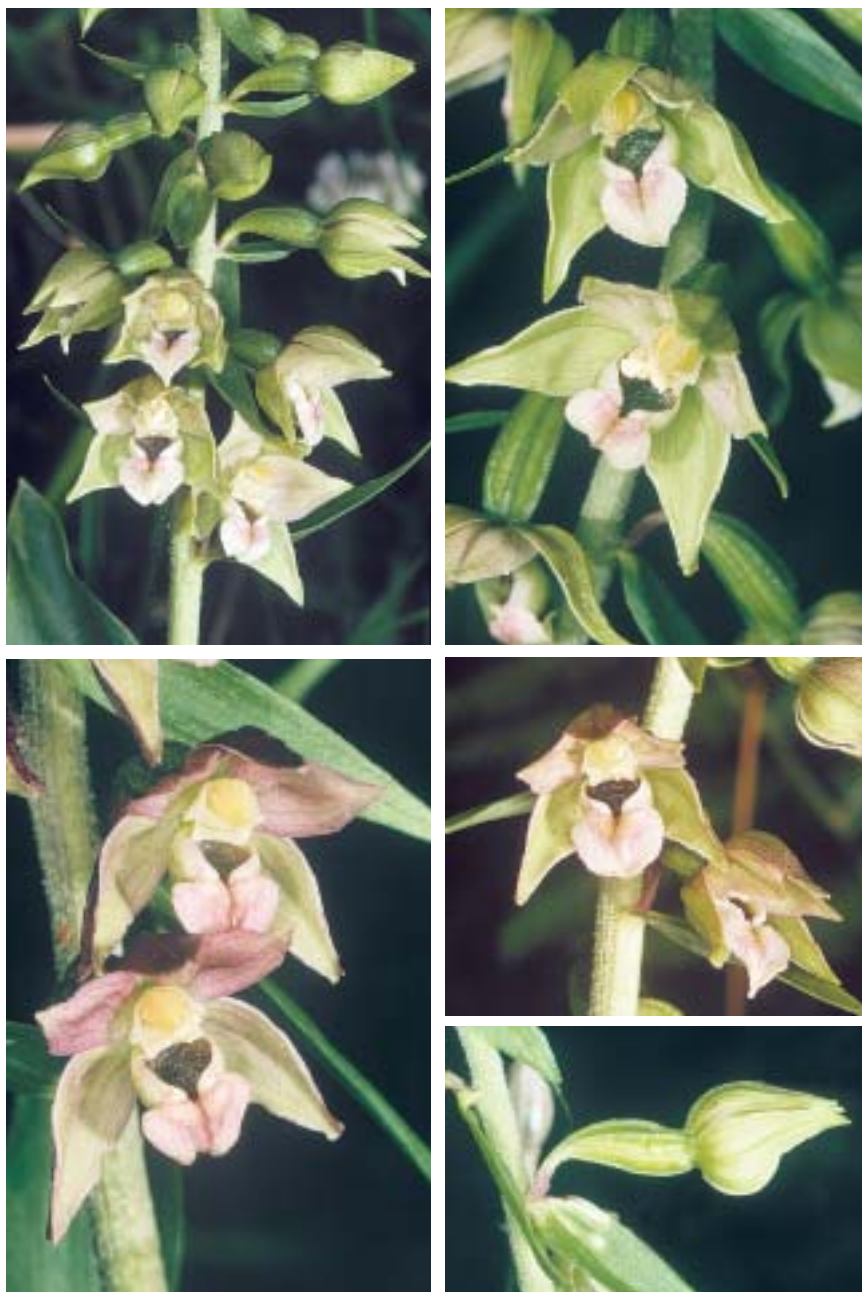
Planche 2. Epipactis heraclea . Phthiotide, mont (Eta. 21.VII.2003).

Inflorescence, fleurs et bouton floral. Inflorescence assez lâche; parois de l'hypochile resserrées à la jonction de l'hypochile avec l'épichile; épichile important, plus grand que l'hypochile, le sommet rabattu en pleine floraison; ovaire plus court que le bouton floral, pédicelle floral court, teinté de violet.