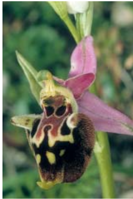
Planche 1. Ophrys dinarica (Croatie)

En haut: Lika, Zrmanja Vrelo, 27.V.2004 (à gauche: holotype)