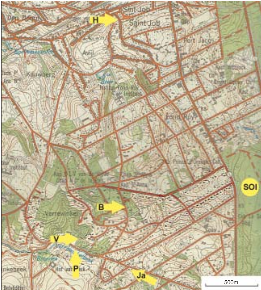
Carte 1. Situation de 4 stations ucloises d' Epipactis helleborine .

B. station de l'avenue Blücher; H. station du 1 D rue du Ham (Saint-Job); P. station de la rue de Perck; V. station du bois de Verrewinkel.