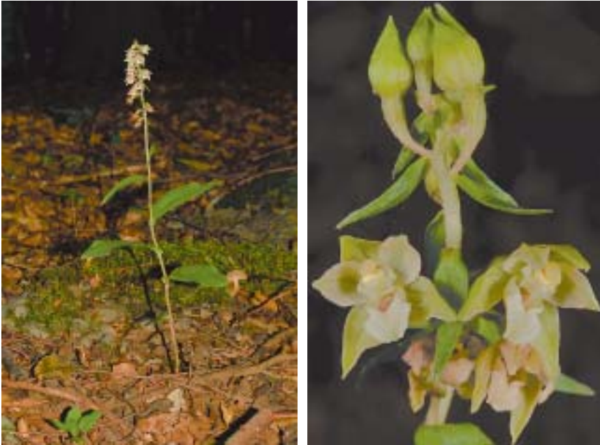
Fig. 1. Epipactis helleborine grêle ("minor") à Woluwe-Saint-Pierre (Bruxelles-Capitale). 5.VIII.2015. À gauche: plante haute de 27 cm, 4 feuilles mollement étalées vert jaunâtre, 13 fleurs; à droite: un autre individu portant 12 petites fleurs peu ouvertes, peu colorées.