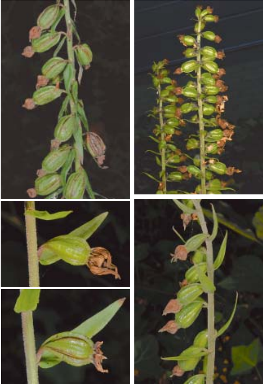
Planche 5: position des ovaires fructifiant chez Epipactis helleborine .

À gauche: exemplaire T ; en haut: avant transplantation, plante robuste, ovaires presque tous pendants. 17.X.2011; en bas: après transplantation, plante assez grêle, ovaire presque horizontal durant toute la fructification. 15.IX.2016 et 6.X.2016. À droite: site H; en haut: 2 plantes robustes, 51 et 38 fleurs, ovaires horizontaux; en bas: plante grêle, 11 fleurs, ovaires pendants. 15.VIII.2016.