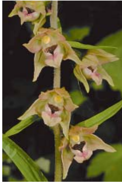
Planche 4: Exemple T 1 (2013 et 2016).

À gauche: 2013; plante grêle haute de 29 cm, 6 feuilles, 8 petites fleurs peu ouvertes et peu colorées; épichile de coloration "type E. meridionalis ". 24.VII.2013. À droite: 2016; plante un peu moins grêle, haute de 41cm, 7 feuilles, 15 fleurs un peu plus colorées. 24.VII.2016.