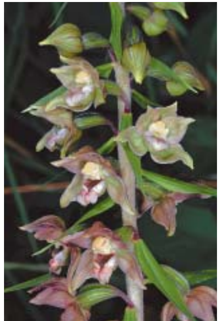
Planche 3: Exempleire T 1 (2011 et 2012).

À gauche: 2011, avant transplantation, au site P; plante robuste haute de 56 cm (flèches indiquant la base et le sommet de la tige), 9 feuilles, 43 fleurs grandes, colorées. 15.VII.2011. À droite: 2012, après transplantation; plante (1) robuste haute 48 cm, 8 feuilles, 41 fleurs bien colorées. 24 & 31.VII.2012. (la flèche indique le sommet de la tige)