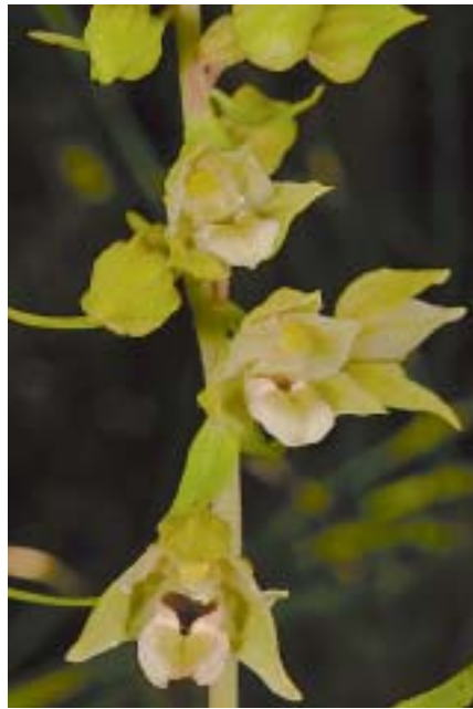
Planche 1. Epipactis helleborine grêle (" minor ") en Wallonie. 16.VII.2014.

À gauche: Lavaux-Sainte-Anne; en haut: plante haute de 18 cm, 9 fleurs; en bas: un autre individu: inflorescence unilatérale, 11 fleurs peu ouvertes, peu colorées. À droite: Ave-et-Auffe; en haut: plante haute de 24,5 cm, hampe de 2013 haute de 37 cm (flèche = sommet); en bas: fleurs peu ouvertes, très pâles; épichile coloré comme les E. meridionalis hypochromes.