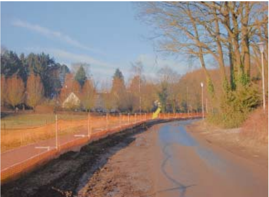
Planche 2: le site P (rue de Percke, Uccle).

La flèche jaune indique l'emplacement de l'exemplaire T 1 .