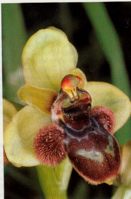
FIG. 2. — Ophrys × mannarica . I. Taranto. 04.04.1986.